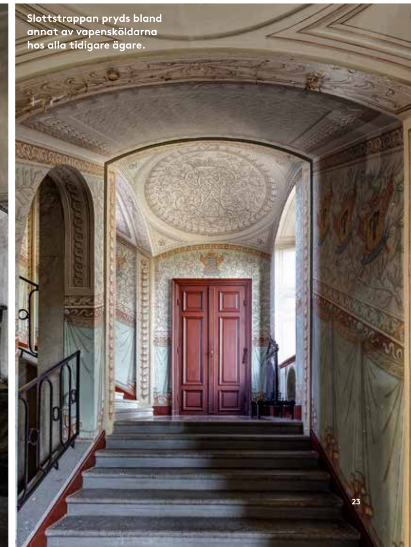
Slottstrappan pryds bland annat av vapensköldarna hos alla tidigare ägare.