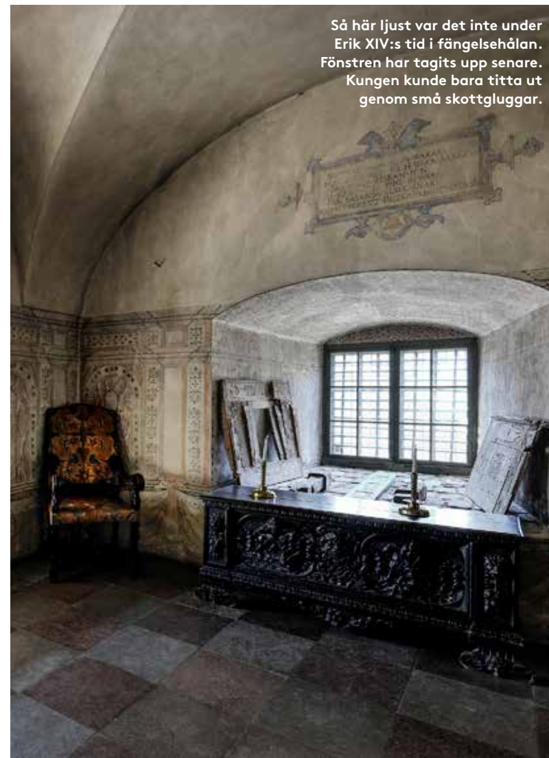
Så här ljust var det inte under Erik XIV:s tid i fängelsehålan. Fönstren har tagits upp senare. Kungen kunde bara titta ut genom små skottgluggar.