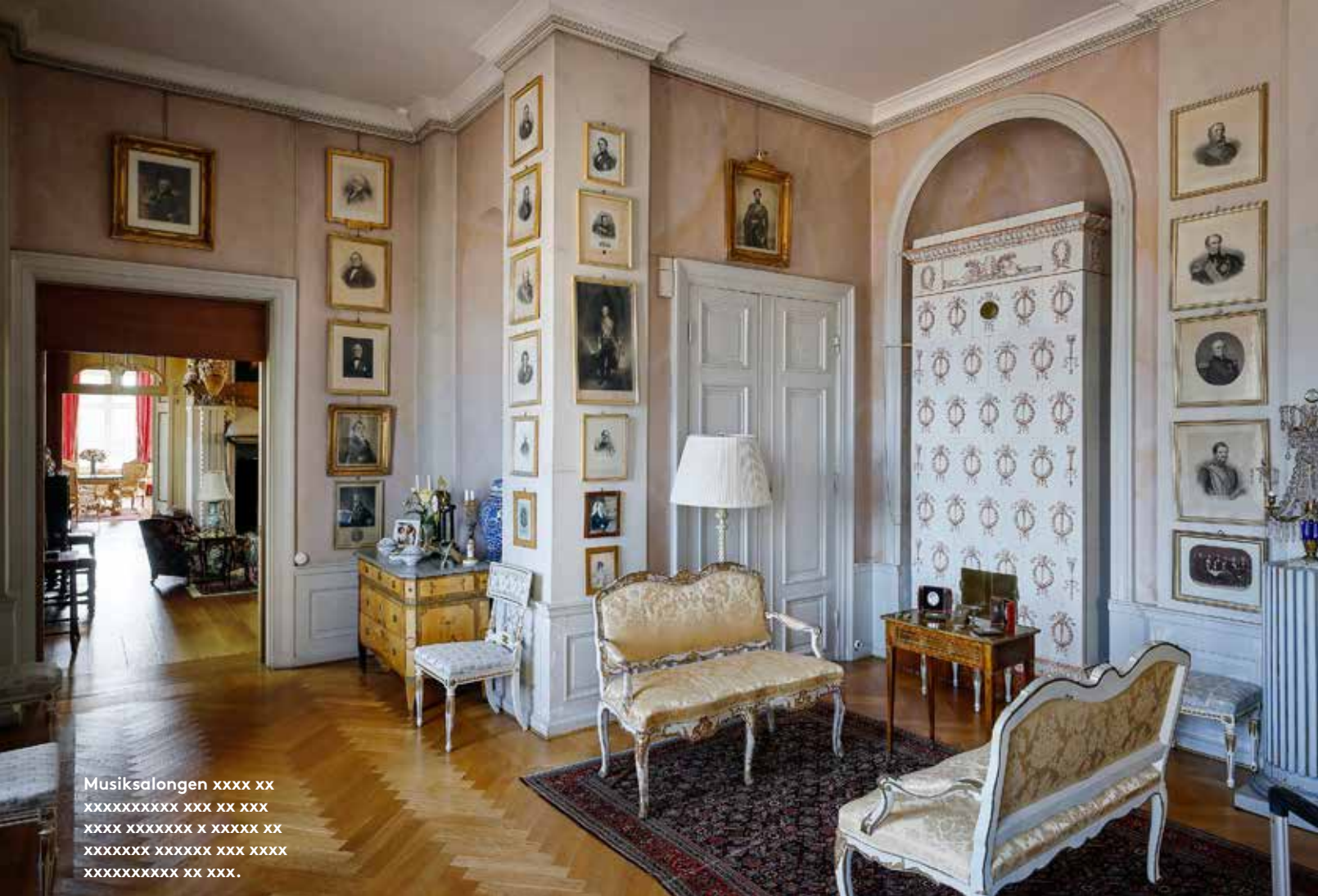
Musiksalongen xxxx xx xxxxxxxxxxxx xxx xx xxx xxxxx xxxxxxxx x xxxxx xx xxxxxxxx xxxxxxxx xxx xxxxx xxxxxxxxxxxx xx xxx.