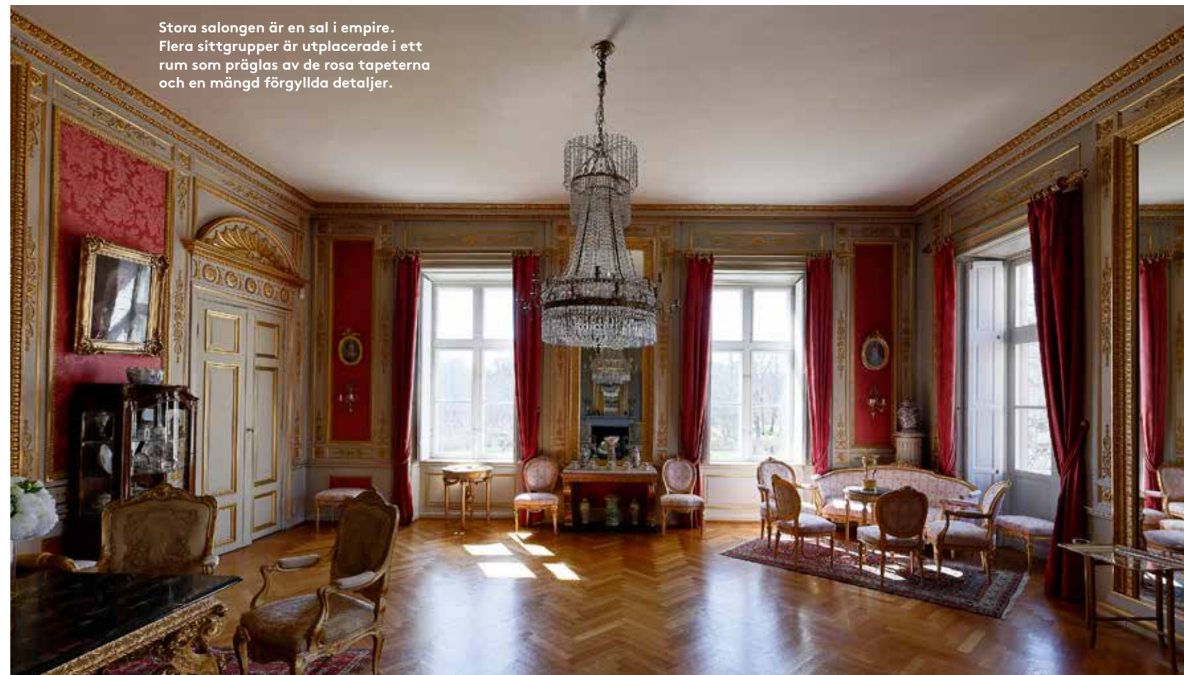
Stora salongen är en sal i empire. Flera sittgrupper är utplacerade i ett rum som präglas av de rosa tapeterna och en mängd förgyllda detaljer.

Franska biblioteket enligt Slott och herresäten i Sverige.