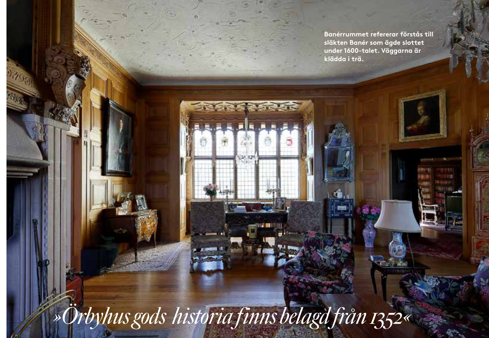
Banérrummet refererar förstås till släkten Banér som ägde slottet under 1600-talet. Väggarna är klädda i trä.

»Örbyhus gods historia finns belagd från 1352«