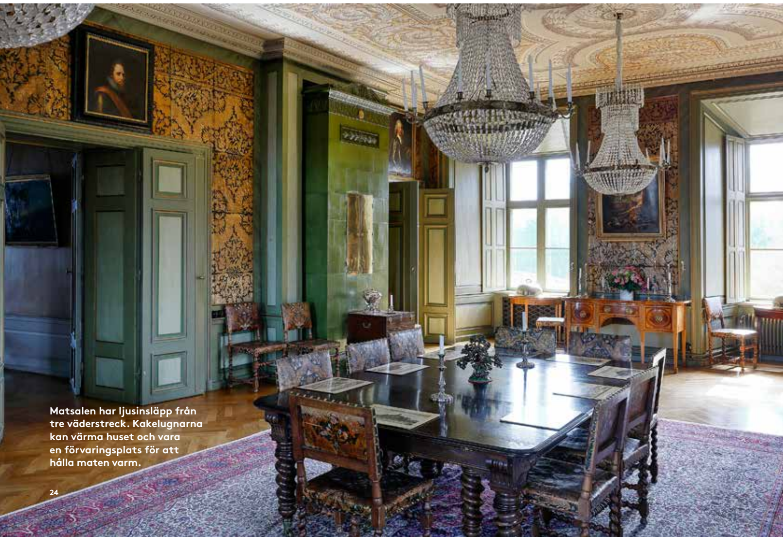
Matsalen har ljusinsläpp från tre väderstreck. Kachelugnarna kan värma huset och vara en förvaringsplats för att hålla maten varm.

»Örbyhus gods historia finns belagd från 1352«