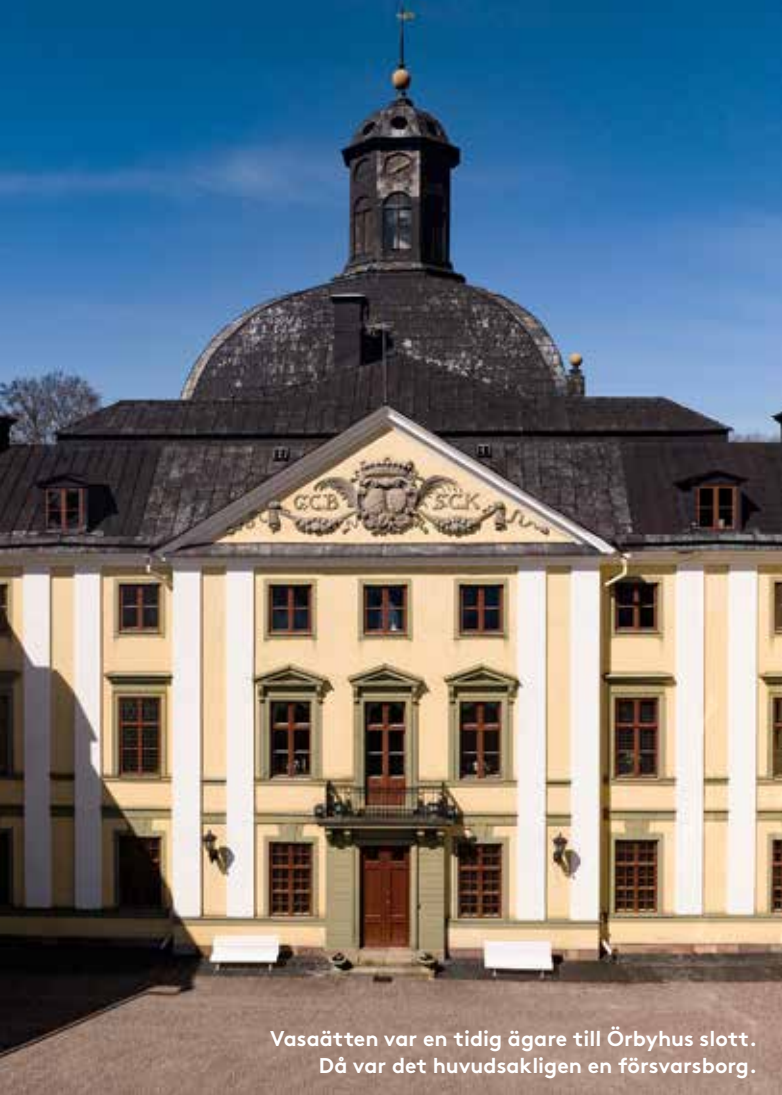
Vasaätten var en tidig ägare till Örbyhus slott. Då var det huvudsakligen en försvarsborg.

V i befinner oss i norra Uppland. Drygt fyra mil söderut ligger Uppsala. Inom några mils avstånd hittar man typiska brukssamhällen som Dannemora, Österbybruk och Gimo. En mil sydväst om Örbyhus slott ligger Vendels kyrka där man 1881 upptäckte ett antal båtgravar. De döda hade fått med sig attribut som svärd, hjälmar, sköldar och mycket mer. Fynden var så betydande att de fått ge namnet till en hel historisk epok, Vendeltiden. Den omfattar åren mellan 550 och 800 e. Kr. Alltså långt före den första dateringen av Örbyhus slott.