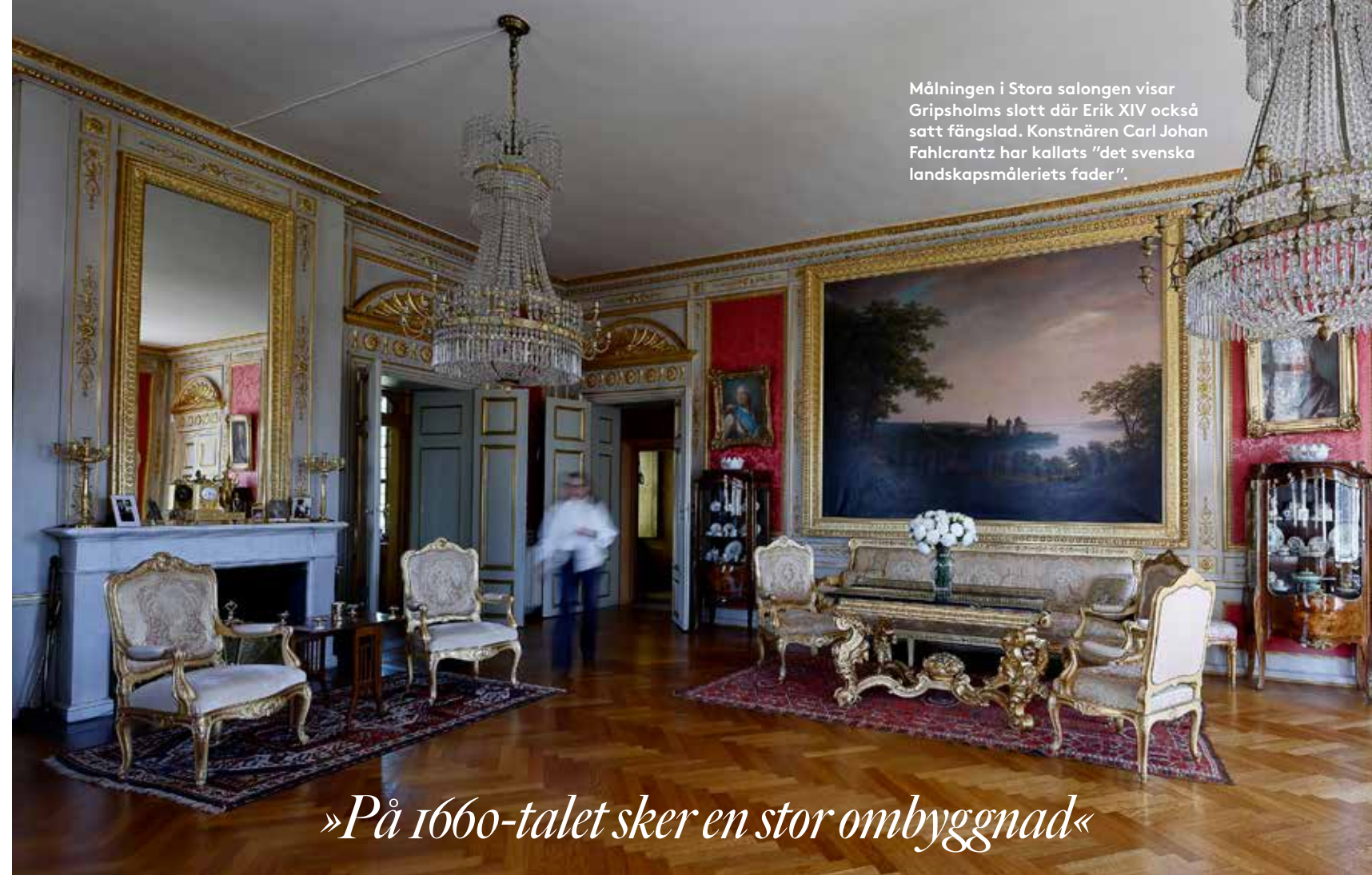
Målningen i Stora salongen visar Gripsholms slott där Erik XIV också satt fängslad. Konstnären Carl Johan Fahlcrantz har kallats "det svenska landskapsmåleriets fader".

1823 upprättas en generalplan med omfattande förändringar på >